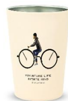
2 WAY 真空二重タンブラー 3,630 円