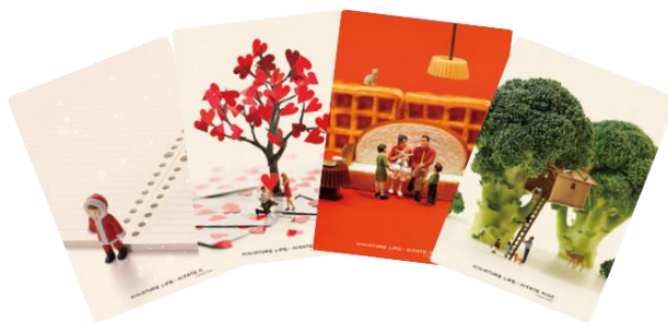
クリアファイル（A4 サイズ） 各 440 円