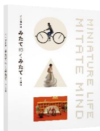
展覧会公式図録 2,200 円