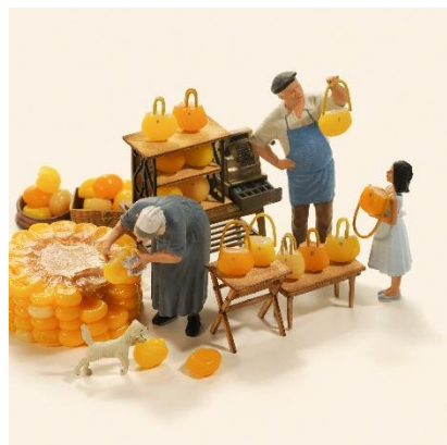
⑤コーンなバッグはいかがでしょう？