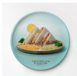
バンブーファイバープレート 2,310 円