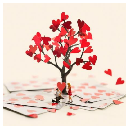
⑦プロポーズの切り札