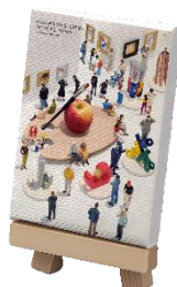
ミニキャンパス 990 円

※画像は実際の商品とは異なる場合がございます。 ※数に限りがございます。売切れの際はご容赦ください。 ※価格は消費税を含む総額にて表示しております。