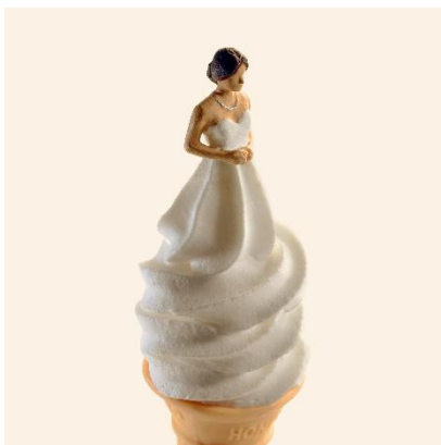
④アイスをすることを誓います